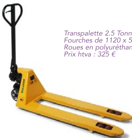
Transpalette 2.5 Tonnes Fourches de 1120 x 550 mm Roues en polyuréthane Prix htva : 325 €