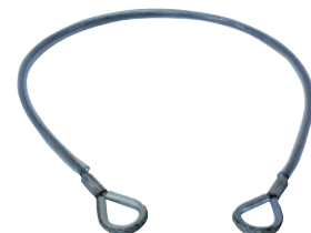
Elingue AM 401G Longueur 1 m. Résistance 22 KN. Conforme EN 795.