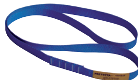
Anneau de sangle AM 450/80 Longueur 80 cm. Résistance 22 KN. Conforme EN 795.