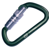
Mousqueton Alu AJ531 Ouverture 17 mm Résistance 28 KN. Conforme EN 362.