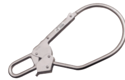
Mousqueton à vis type PRAJ 592 Ouverture 85 mm. Résistance 18 KN. Conforme EN 362.