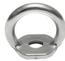
Point d'ancrage type PRAM 211 Acier inox. Conforme EN 795/A. Fixation par boulon inox. M12. Résistance 12 KN.