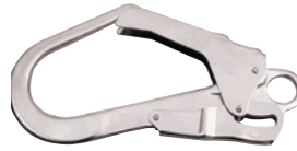
Mousqueton à vis type PRAJ 595 Ouverture 50 mm. Résistance 24,5 KN. Conforme EN 362.