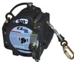
Ligne de vie temporaire EZ LINE Longueur 18 m Câble en acier galvanisé de 8 mm 2 utilisateurs maximum Conforme EN 795C.