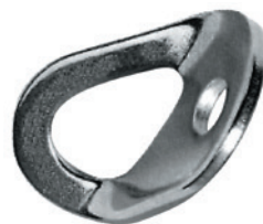
Point d'ancrage type PRAM 210 Acier inox. Conforme EN 795/A. Fixation par boulon inox. M12. Résistance 12 KN.