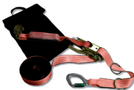
Ligne de vie temporaire Proline Rapide et simple de mise en œuvre 2 utilisateurs maximum Conforme EN 795/C